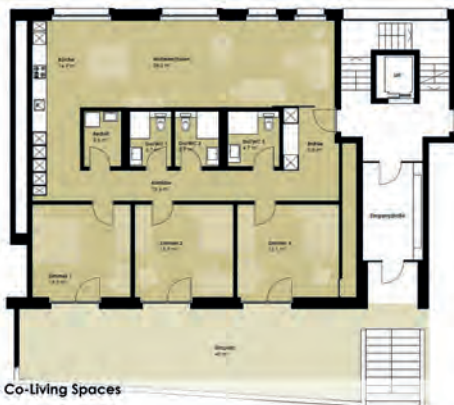
Grundriss - Co-Living Spaces